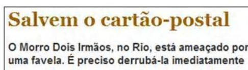
Figura 2: Título da matéria

As palavras utilizadas no título e subtítulo denotam este preconceito, incitando a ideia de que as favelas são uma ameaça e devem ser eliminadas.