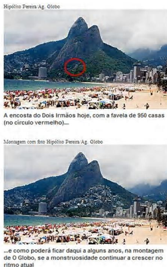
Figura 3: Foto original e montagem

No enquadramento do discurso do idílio , que trata a favela como um lugar bom de se viver, onde as pessoas são amigas e solidárias pela própria situação em que vivem, também é mostrado o lado “romântico”, as origens do samba, do carnaval, e o berço de várias manifestações culturais como o rap , o funk , o hip hop , como características positivas. Também neste enquadramento aparecem várias matérias que trazem projetos de arte, cultura e esporte como forma de transformação de vida.