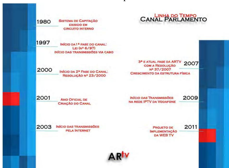
Gráfico 3 - Linha do Tempo Canal Parlamento 19

Os novos procedimentos definidos pela Resolução nº 37/2007 inaugurou a última e atual fase do Canal Parlamento, ainda em processo de realização, aproximando a emissora aos recentes modelos de TV Legislativa criados no Mundo. Em 2008 ocorre o início das transmissões na rede MEO, outra empresa portuguesa de serviços de televisão via cabo, e em 2009 a rede IPTV da Vodafone, operadora de móvel multinacional com sede na Alemanha e presente em 42 países, inclusive Portugal, passou a distribuir o sinal da ARTV. Para 2011, a previsão é de implementação da plataforma de WEB TV.