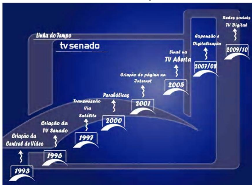
Gráfico 2 - Linha do Tempo TV Senado 9