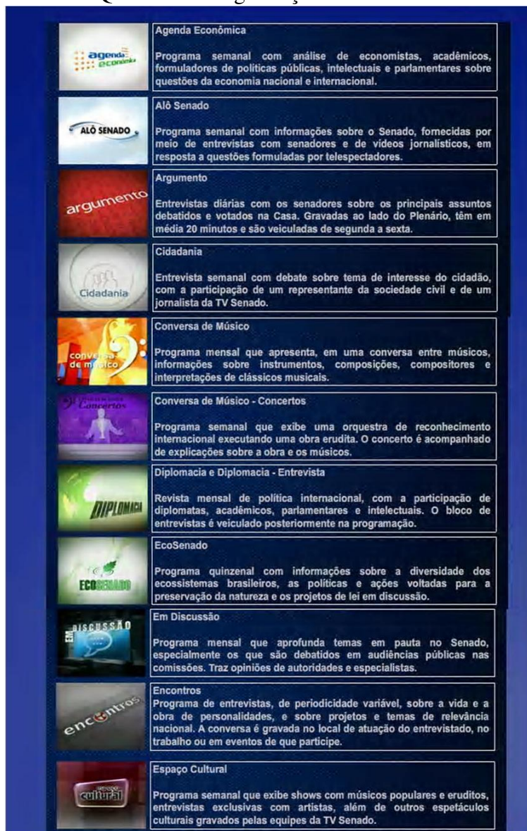
Quadro 1 – Programação TV Senado 11